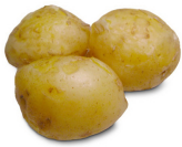
2 kokta potatisar